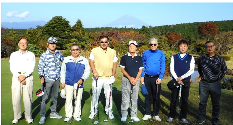
「グランフィールズカントリークラブ」(三島市)にて開催。8名参加。