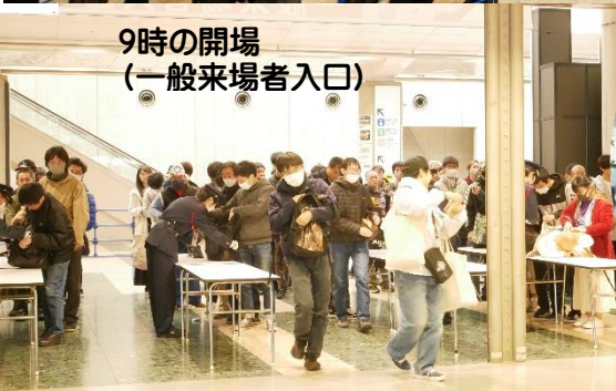
9時の開場 (一般来場者入口)