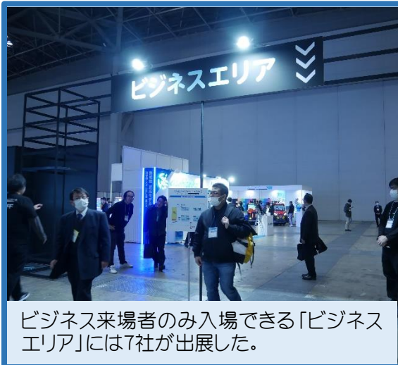
ビジネス来場者のみ入場できる「ビジネスエリア」には7社が出展した。

列の先頭でランプをしながら開場を待つグループ。関東地区からそれぞれ集まった20代前後のメンバーはゲームを通じて仲間になった。「ゲームもさることながら、最大の目的はみんなとのコミュニケーションです」。