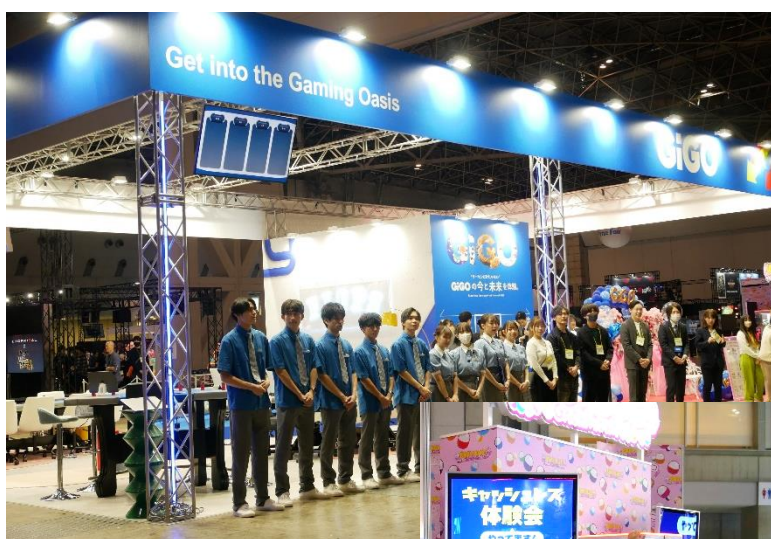
新生アミューズメントエキスポは、業界全体からの出展を誘致。今回、オペレーター企業も2社出展。