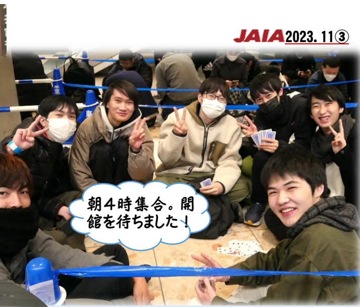
朝4時集合。開館を待ちました!