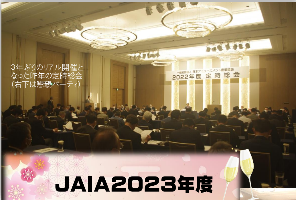
3年ぶりのリアル開催となった昨年の定時総会 (右下は懇親パーティ)