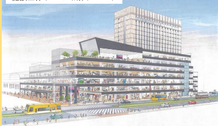
施設全体イメージ(断面パース)

「ホールは着座で400名収容。屋上庭園と連動した新たな都市機能として整備します。是非、JAIA情報交換会はまた鹿児島で！」と犬伏本部長は笑う。